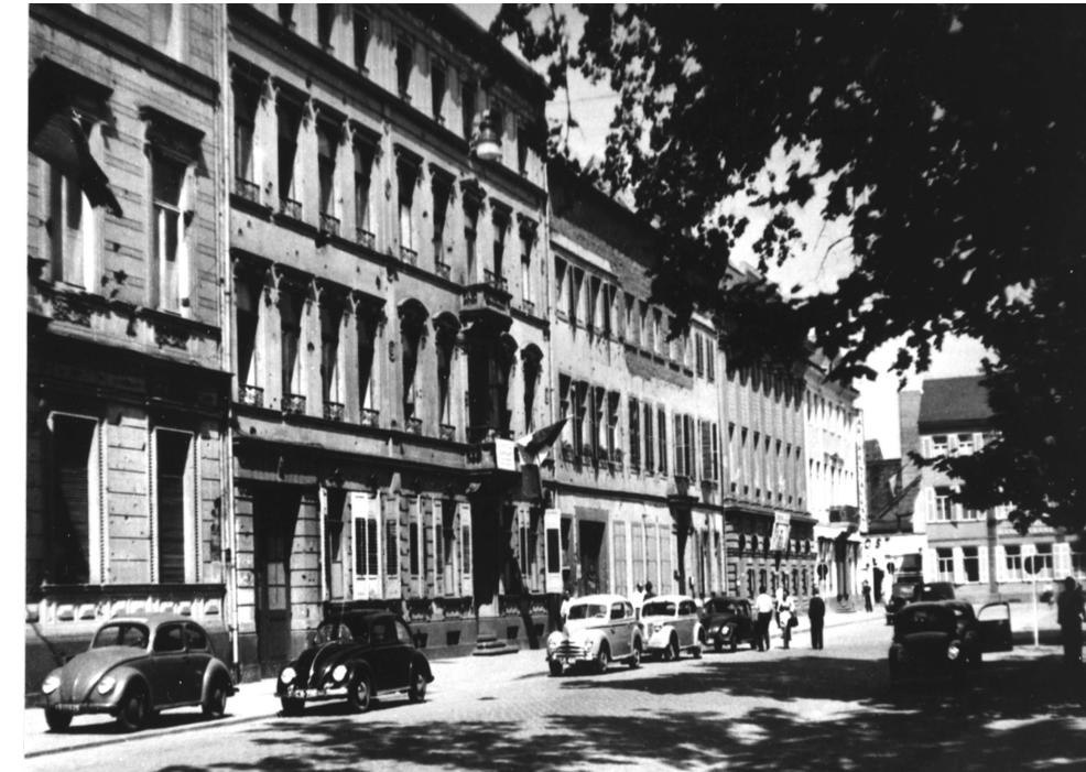
Außenansicht Neustadt 4 (nach dem Zweiten Weltkrieg)