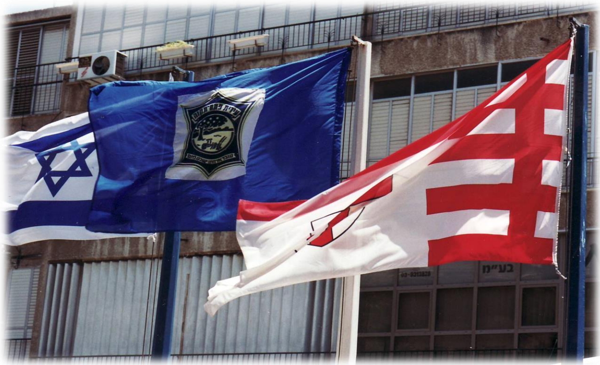
Flaggen zeigen die Städtepartnerschaft an.

Kontakt: Freundschaftskreis Koblenz-Petah Tikva e.V., Schöffengasse 1, 56070 Koblenz | Tel.: 0261 85801 | Mail: veranstaltungen@fsk-ko-pt.de | www.fsk-ko-pt.de