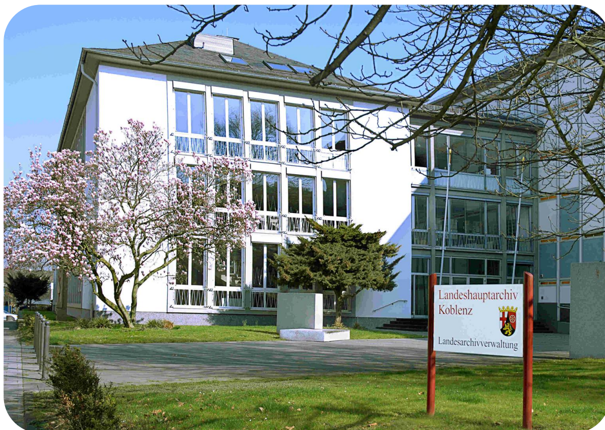
Gebäude des Landeshauptarchivs Koblenz

Kontakt: Verein für Geschichte und Kunst des Mittelrheins, c/o Landeshauptarchiv Koblenz, Karmeliterstraße 1-3, 56068 Koblenz | Tel.: 0261 9129-0 | Mail: info@vgkm.de | www.vgkm.de