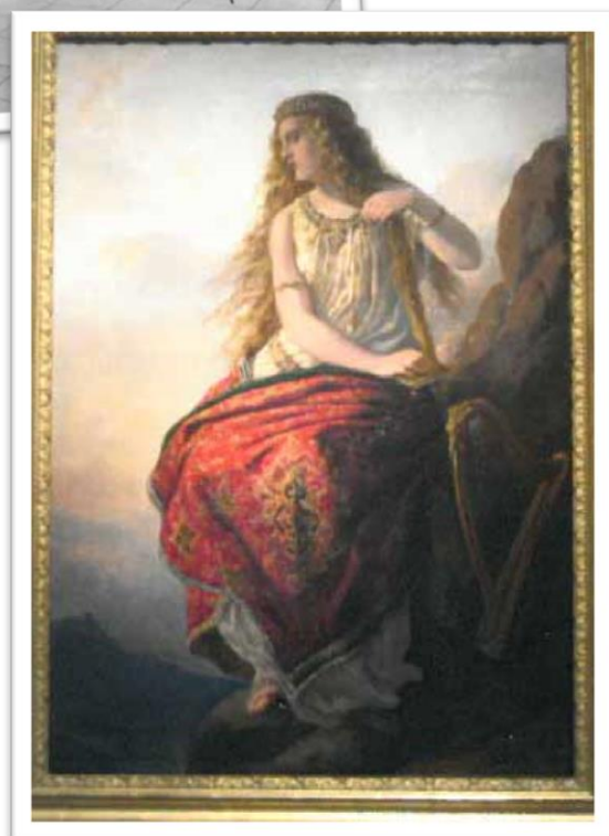
Entdecken Sie das Rheinmuseum: Dreizylinder-Expansions-Dampfmaschine (links) Gemälde der Loreley (rechts)