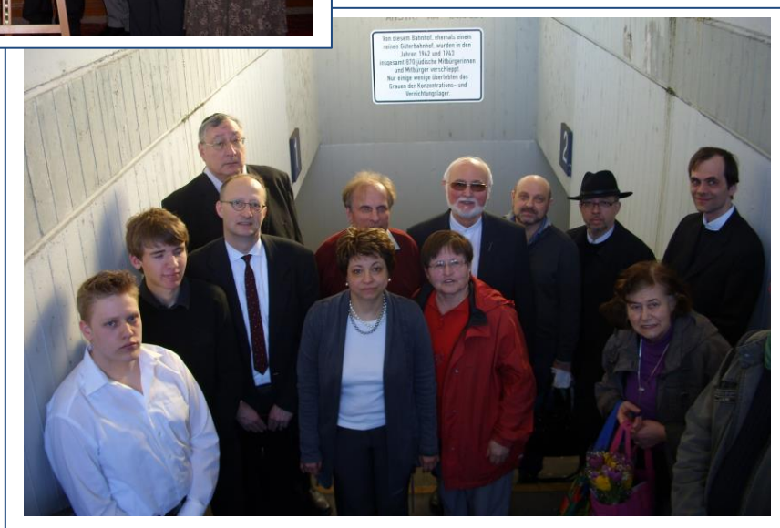
Feier im Historischen Rathausaal anlässlich der Verleihung des Paul-Eisenkopf-Preises im Jahr 2013 (links) | Einweihung der Gedenktafel am Lützeler Bahnhof im Jahr 2014 (rechts) | Fotos: CJGK

Im Jahr 2013/14 konnten auf Initiative der CJGK in Kooperation mit dem Förderverein Mahmal Koblenz, dem Freundschaftskreis Koblenz-Petah Tikva und dem Beratungsbüro Sinti und Roma Koblenz sowohl eine Laufschrift im Hauptbahnhof Koblenz zum Gedenken an die deportierten Opfer des Nationalsozialismus sowie eine entsprechende Gedenktafel am Bahnhof Lützel installiert werden.