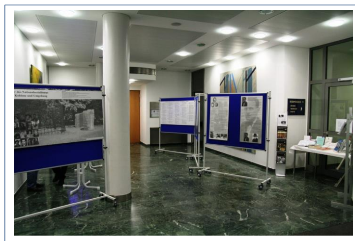
Eröffnung der Ausstellung im Landtag Rheinland-Pfalz, in Mainz, 18. Januar 2007 (oben) Ausstellung im Oberverwaltungsgericht in Koblenz, 2006