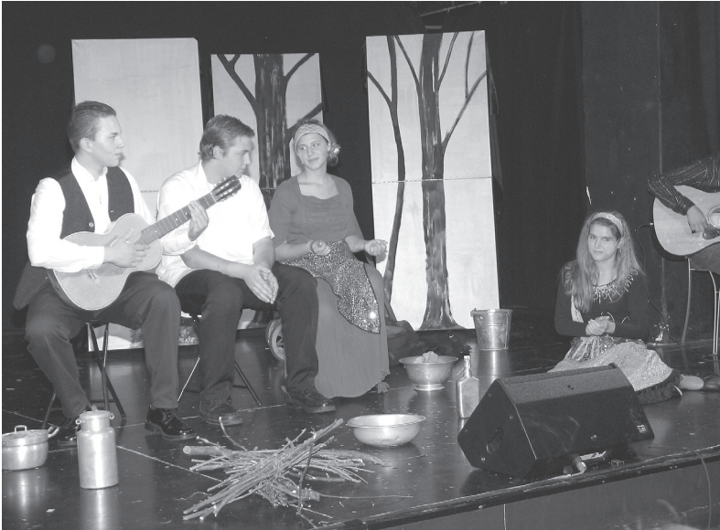
Musiktheater „Von schwarzen Augen und gelben Sternen“ „Zigeuner“ auf der Flucht vor den NS-Schergen am Lagerfeuer