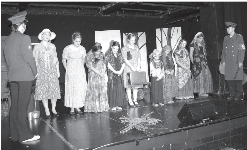
Musiktheater „Von schwarzen Augen und gelben Sternen“ Juden und „Zigeuner“ werden abgeführt